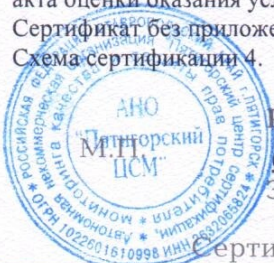
Схема сертификации 4.

Руководитель органа (заместитель руководителя) Эксперт