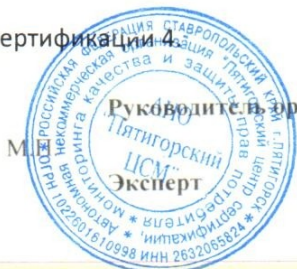
Схема сертификации 4

Акта оценки оказания услуг № 1174 от 21.04.2026; протокола проверки результата оказания услуг № 1174 от 21.04.2026